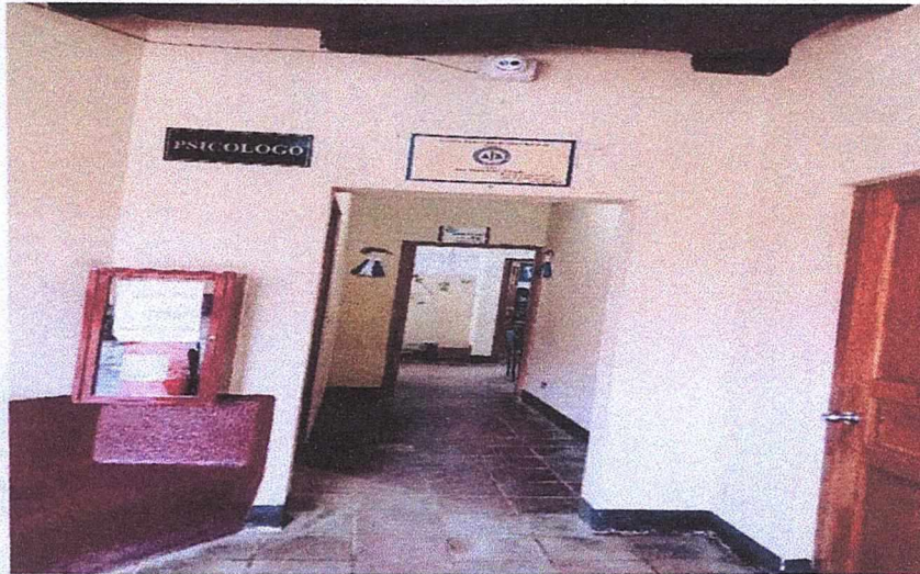
Oficina del Administrador del CAJ y Bufete Popular.